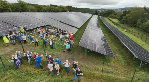
Aktiventreff an der Freiflächenanlage in Letmathe